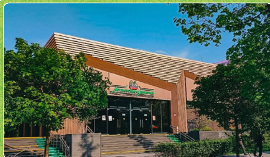
СТИЛЬ «ФЕРМЕРСКАЯ ЯРМАРКА»

ЦАО, Арбат, Б. Николопесковский пер., вл. 8 ЦАО, Басманный, Бакунинской ул., вл. 24 САО, Дмитровский, пересечение Дмитровского ш. и ул. Лобненская САО, Савеловский, Нижняя Масловка ул., вл. 2 САО, Бескудниковский, Бескудниковский бульвар, вл. 59 СВАО, Бутырский, Милашенкова ул., вл. 14 СВАО, Ярославский, Ярославское шоссе, вл. 111 СВАО, Отрадное, Алтуфьевское шоссе, вл. 30Г СВАО, Отрадное, Отрадная ул., вл. 16 СВАО, Южное Медведково, Полярная ул., вл. 10 ВАО, Перово, Зелёный пр-т, вл. 2 ВАО, Вешняки, Кетчерская ул., вл. 4Б (напротив) ВАО, Ивановское, Челябинская ул., вл. 15 ЮВАО, Кузьминки, Юных Ленинцев ул., вл. 52 ЮВАО, Рязанский, Академика Скрябина ул., вл. 4 ЮАО, Орехово-Борисово Северное, ул. Домодедовская, вл. 12 ЮАО, Бирюлево Восточное, Михневская ул., вл. 9/1 ЮАО, Царицыно, Пролетарский пр-т, вл. 24 ЮАО, Бирюлево-Западное, Булатниковский проезд, вл. 14 ЮАО, Чертаново Южное, Россошанский пр-д, вл. 8, к. 2 ЮАО, Зябликово, Ореховый бульвар, вл. 24 ЮЗАО, Черемушки, Профсоюзная ул., вл. 41 ЗАО, Раменки, Раменки ул., вл. 3 ЗАО, Фили-Давыдково, Ватутина ул., вл. 18, к. 2 ЗАО, Можайский, Барвихинская ул., вл. 6 ЗАО, Ново-Переделкино, Чоботовская ул., вл. 1 ЗАО, Очаково-Матвеевская, Матвеевская ул., вл. 2 СЗАО, Хорошово-Мневники, Саляма Адила ул., вл. 4 СЗАО, Южное Тушино, Свободы ул., вл. 57