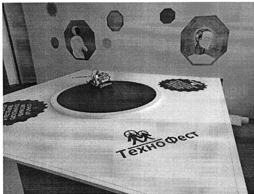
Рис.3 Ринг в виде подиума